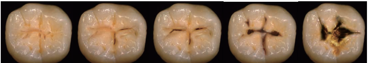
Espelid et al より

問30.患者は30歳の女性で、全身的な既往に特記事項はありません。患者は本日定期歯科健診で受診し、特に主訴はありません。これまでの6年間あなたの診療所に2年に一度定期健診の受診を続けています。写真に示す箇所以外に処置歯やう蝕、および欠損歯が一本もありません。写真に示す歯に対してあなたはどのような治療を行いますか？5つの症例すべてについてそれぞれお答えください。